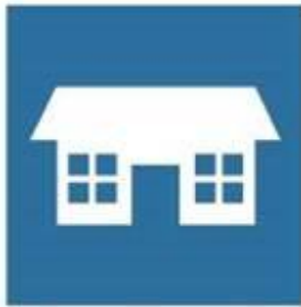
Number of Libraries