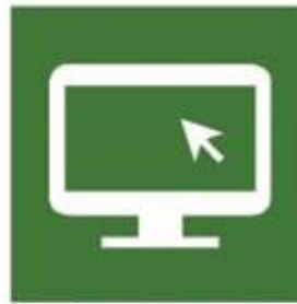
Libraries with Internet Access